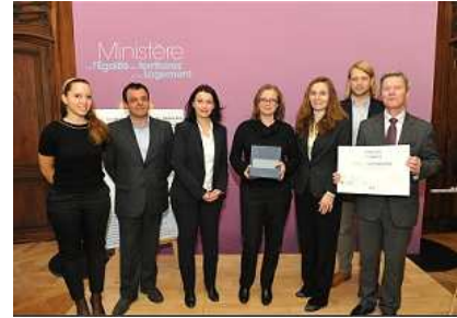
Energies POSIT'IF à l'honneur au Palmarès 2013 des initiatives locales pour la rénovation énergétique, Lire la suite